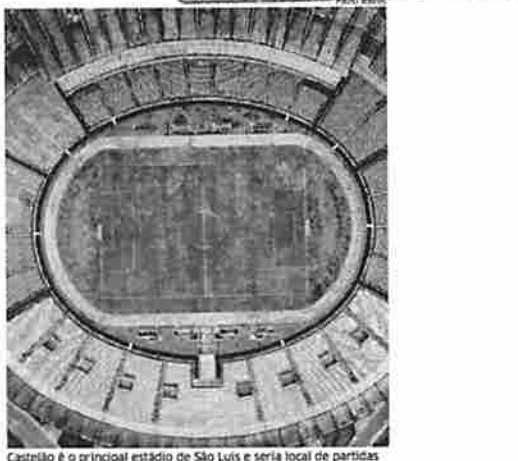
Castelão é o principal estádio de São Luís e seria local de partidas

AVISO DE LICITAÇÃO PÚBLICA TOMADA DE PREÇOS Nº 022/2021 O Município de Trizalão do Vale (MA), através da Câmara Municipal de Trizalão do Vale, torna pública aos interessados que, em base na Lei nº 10.520/02, Lei Complementar nº 133/2006 e subsidiariamente as disposições da Lei nº 8.666/93 e suas alterações posteriores, terá realizado em 09h30min (nove horas) 09:30h dia 14 de junho de 2021, a licitação na modalidade Pregão nº 022/2021, do tipo menor preço por item, tendo como objeto: O Pregão de Preço para eventual contratação de prestação jurídica para prestação de serviços de fiscalização de realidade leve de empresas da Câmara Municipal de Trizalão do Vale (MA), de acordo com Edital e Anexo. A presente licitação terá realizada na sede do Município de Câmara Municipal de Trizalão do Vale, situada na Av. Descepo Carlos Melo, nº 1672, Aeroporto, Trizalão do Vale - MA, em data a ser determinada pelo Município de Trizalão do Vale, através de ato de convocação para o endereço acima, do 2º e 3º dia, no horário das 09h30min às 12h00min, no endereço eletrônico www.bonmunicacoes.com.br , e no endereço eletrônico www.transparenciaoaberto.org.br , e no endereço eletrônico www.licitacoes.com.br , onde poderão ser consultados e retirados gratuitamente os documentos adicionais no mesmo endereço eletrônico. Trizalão do Vale - MA, em 28 de maio de 2021. Ronaldo Everton de Lucas Pereira - Presidente da Câmara Municipal.